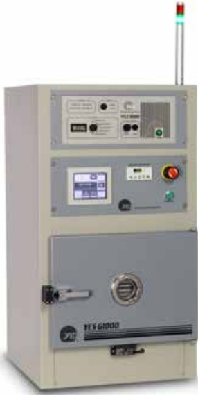
G1000 低频、无电子、 温度可控等 离子清洗机 40KHz, 1000平方 英寸的清洗区域