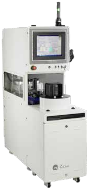
NEW ECO CLEAN 3.56 MHZ 200mm 全自动等离子去胶机