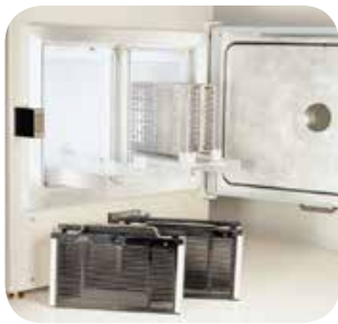
G1000LMC 料盒等离子清 洗应用