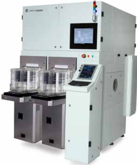
VertaCure 全自动FOWL P烘箱