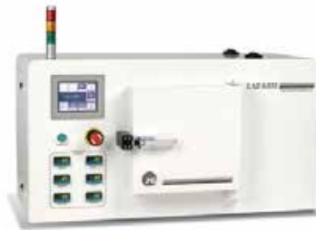
NEW LabCoat实验室CVD化学气相沉积系统