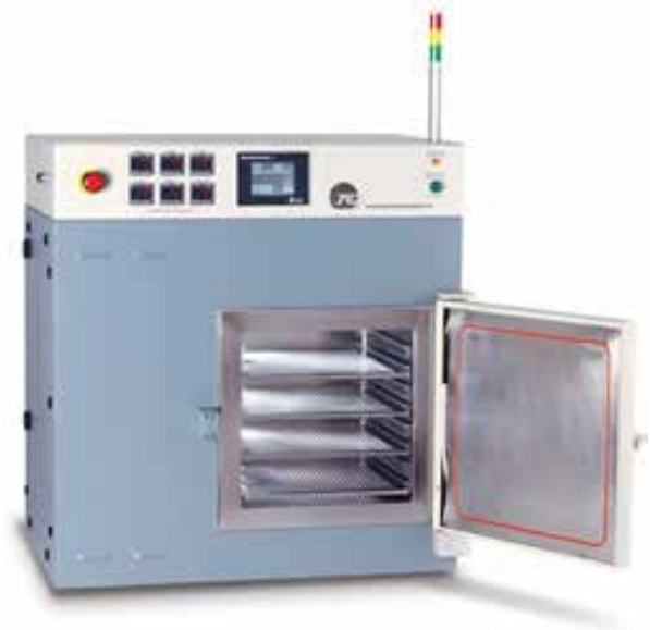
1224P CVD化学气相沉积系统