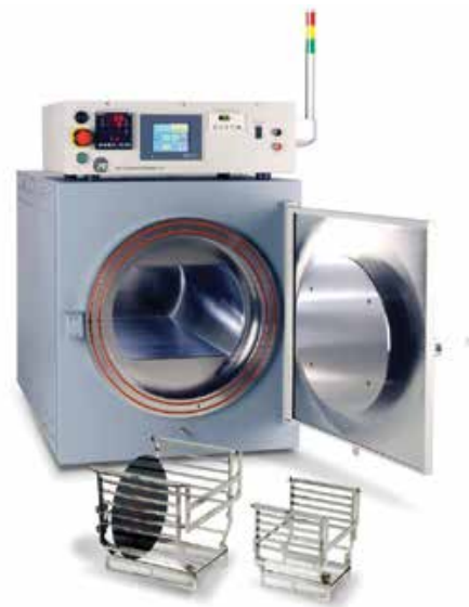
450PB 高真空、450°C高温、Class 1<10ppm O2 高清洁度BCB, PI FOWL P烘箱系统